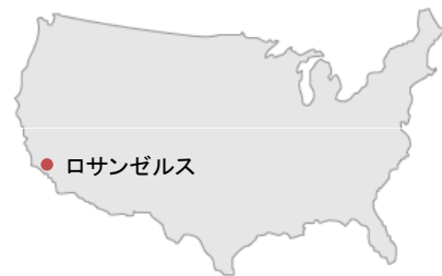
プログラム日程表(予定)

ライフガード見学でビーチに行ったり、スペースシャトル・エンデバーの展示のあるディスカバリーサイエンスセンター(体験型科学館)へ見学研修へ行きます♪